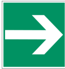
Rundweg nicht verlassen